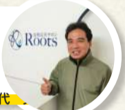
【主訴】坐骨神経痛・椎間板ヘルニア 40代

産後からの腸腰筋の痛みと、急なぎっくり腰で来院させていただきました。 的確なカウンセリングで、何より患部を触ることなくぎっくり腰を治療してください、姿勢やセルフケアも丁寧に教えて下さり、実践した結果、ぎっくり腰も完治し、何より産後から何をしてもダメだった腸腰筋の痛みがびっくりするくらいキレイになりました!! 採み返しも一切なく身体と心の根本治療に感動しました。