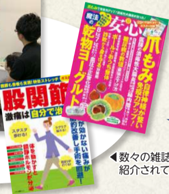
◀数々の雑誌で紹介されています!