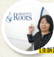
【主訴】ギックリ腰 50代 女性

原因不明の左足の違和感を放置して2ヶ月。違和感は足の指のしびれと足のビリビリした痛みが悪化してしまいました。ヘルニアを原因とする坐骨神経痛でしたが、どう対処して良いかわからず、さすがの思いでルーツさんを訪れました。痛い部位に合った適切なストレッチを教えてくださいいただきさっそく自宅で実践。少しずつ薬やシップに頼らない改善方法には目からウロコです。自身の体についての理解も深まり学ぶことも多いです。ありがとうございます。