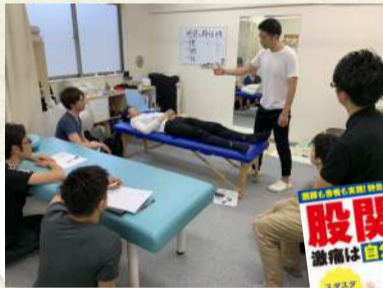
▲セミナーを開催し、柔道整復師や理学療法士への指導も行います。