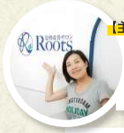
【主訴】慢性腰痛・ぎっくり腰 30代 女性

産後からの腸腰筋の痛みと、急なぎっくり腰で来院させていただきました。 的確なカウンセリングで、何より患部を触ることなくぎっくり腰を治療してください、姿勢やセルフケアも丁寧に教えて下さり、実践した結果、ぎっくり腰も完治し、何より産後から何をしてもダメだった腸腰筋の痛みがびっくりするくらいキレイになりました!! 採み返しも一切なく身体と心の根本治療に感動しました。